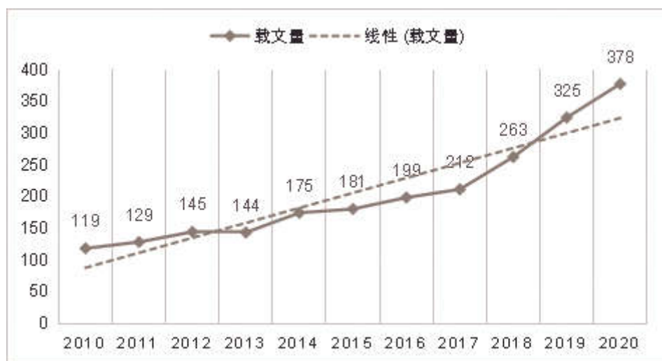
图1 2010年~2020年老年性痴呆照顾者研究的年载文量

2.2 文献来源期刊分布 统计发现,2270篇文献共刊载在347种杂志上。根据布拉德福定律 [9] 中核心期刊的划分标准,发文量排名前7位的期刊为本领域的核心期刊,合计发表679篇文献,占总文献量的34.72%,见表1。值得注意的是发文量排前3名的护理学期刊是《Journal of Clinical Nursing》《Journal of Advanced Nursing》和《Geriatric Nursing》,分别位于总排名为第10、11和12位。