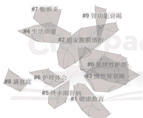
图4 关键词聚类图谱