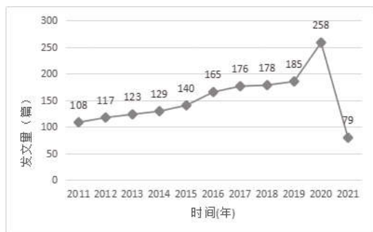
图 1 近 10 年腹膜透析护理发文量时间分布

2.2 发文量时间分析 近 10 年间有关腹膜透析护理的文献发文量均呈现上升趋势,见图 1。