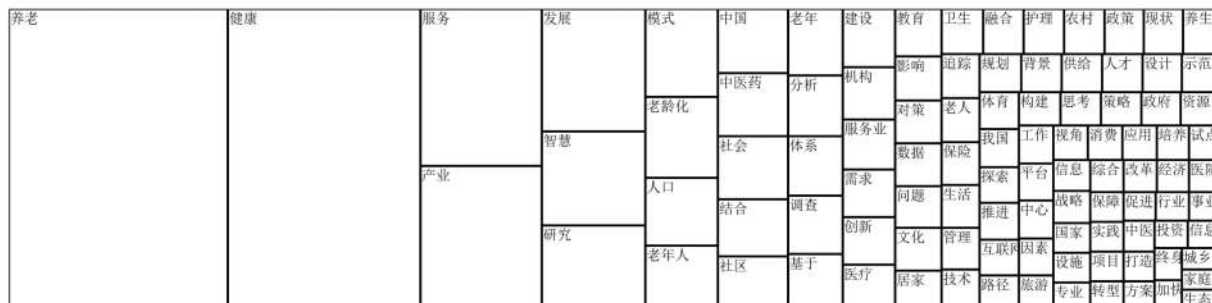
图 3 1996-2021 年健康养老领域相关文献词频矩形式树状结构图

服务、健康养老服务产业、智慧健康养老、健康养老服务模式、中医药健康养老、医养结合、健康养老服务体系等 7 个方面,见图 3、图 4。