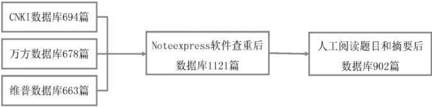
图 1 文献筛选过程图