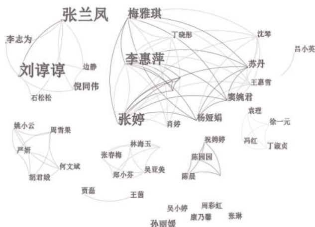
图2 国内主要作者合作网络图谱