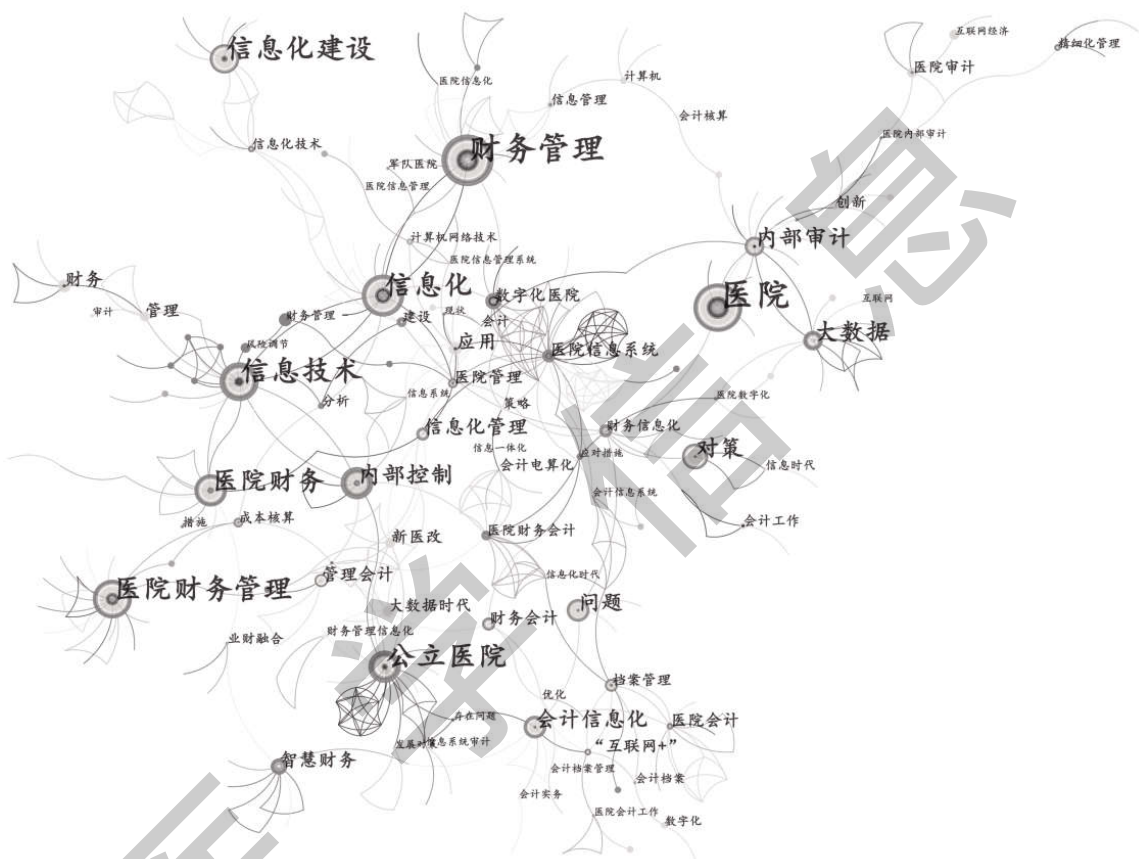
图 2 我国财务管理信息化研究关键词图谱