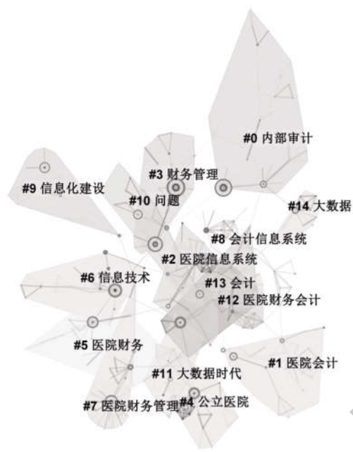
图 3 我国公立医院财务管理信息化关键词聚类图谱